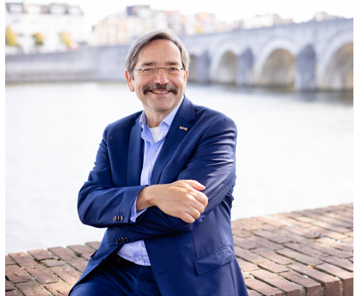
Beeld: Leonard Walpot